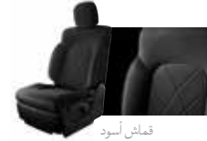
قمائش أسود Black Cloth