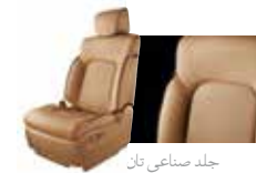
جلد صناعي تان Tan Leatherette