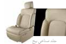
جلد صناعي بيج Beige Leatherette