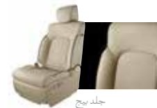
جلد بيج Beige Leather