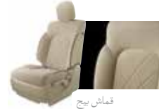
قمائش بيج Beige Cloth